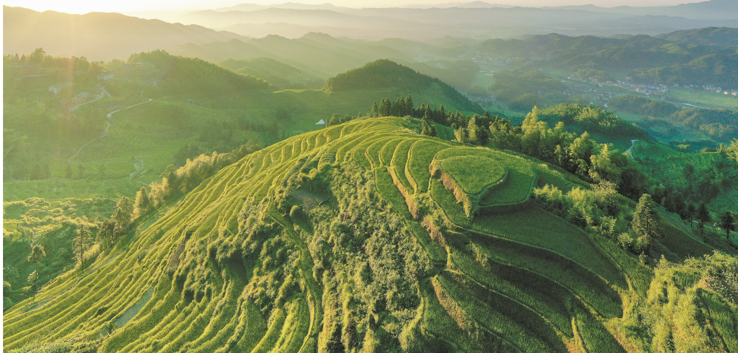
7月12日，娄底市紫鹊界梯田景区，梯田上种满紫鹊界贡米。