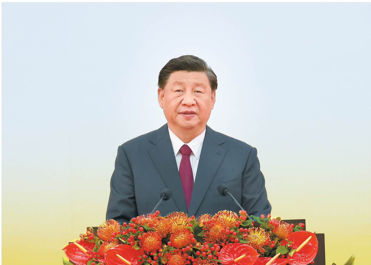
7月1日上午，庆祝香港回归祖国25周年大会暨香港特别行政区第六届政府就职典礼在香港会展中心隆重举行。中共中央总书记、国家主席、中央军委主席习近平出席并发表重要讲话。