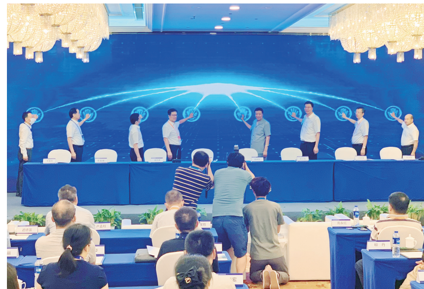
6月26日下午,“森林生态价值实现与绿色发展高层论坛”在长沙召开。