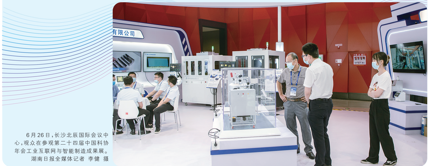
6月26日,长沙北辰国际会议中心,观众在参观第二十四届中国科协年会工业互联网与智能制造成果展。