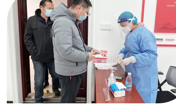
2022年3月25日，省福彩中心青年志愿者在钱隆世家小区为前来检测的居民做信息录入。

奔跑，无畏冬日的严寒，在赛场上挥洒汗水，向着冠军追逐。组建青年兴趣爱好小组，成立中心篮球队、羽毛球队、声乐队等，开展中心青春杯篮球赛、拔河比赛、广播体操比赛等体育活动，让青年在锻炼中强身健体，并以体育活动为载体，加强与社区、周边单位联系互动。开展文体竞赛，举行党史知识竞赛、迎接建团百周年征文比赛、演讲比赛、青年技能大比武等活动，同时积极争取上级机关的迎“五四”青年比武竞赛，多次荣获省民政厅机关青年比武一等奖。