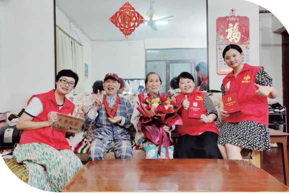
2021年6月28日，湖南省善行福彩志愿服务队参与“微光大义·致敬老党员”志愿服务活动。

“加油！加油！”2020年12月，青春福彩杯如约而至，虽然身在寒风之中，但十支队伍热情不减，你争我抢，全力