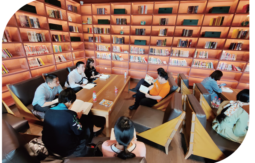
2021年5月6日，省福彩中心团总支前往田汉文化园开展“学党史、强信念、跟党走”主题团日活动。

加强理论学习，筑牢青年思想基石。把学习习近平新时代中国特色社会主义思想作为重中之重，加强青年的思想政治建设。开展集中培训，组织青年到浙江大学参加福彩系统学习《习近平谈治国理政》（第三卷）暨治理能力提升培训班，到湖南师范大学举办党的十九届五中全会精神培训班，联合湖南大学举办学习贯彻党的十九届六中全会精神培训班，常态化举行青年理论集中学习，开展习近平总书记重要讲话学习100周年大会上的重要讲话、在庆祝中国共产主义青年团成立100周年大会上重要讲话，举办读书会分享会，及时跟进学习习近平总书记最新系列重要讲话精神。引导自主学习，结合“不忘初心、牢记使命”主题教育、党史学习教育等，每年购置一批理论书籍让青年自学，运用“学习强国”开展“晒晒分赢书卡”活动，开展《习近平的七年知青岁月》《习近平在宁德》主题讨论，