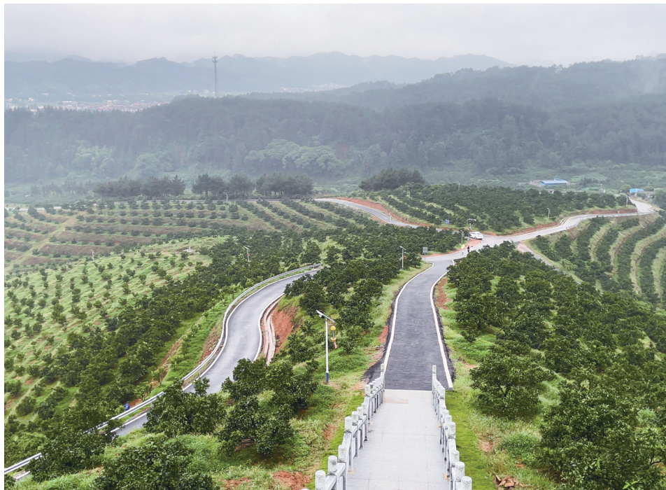
新宁县崑山果业智慧园，橙道在脐橙林中蜿蜒。

全县种植脐橙60万亩，优质果率达85%以上，年产72万吨，产值达55亿元。创建1000亩以上脐橙标准园104个、现代农业特色产业园省级示范园8个。