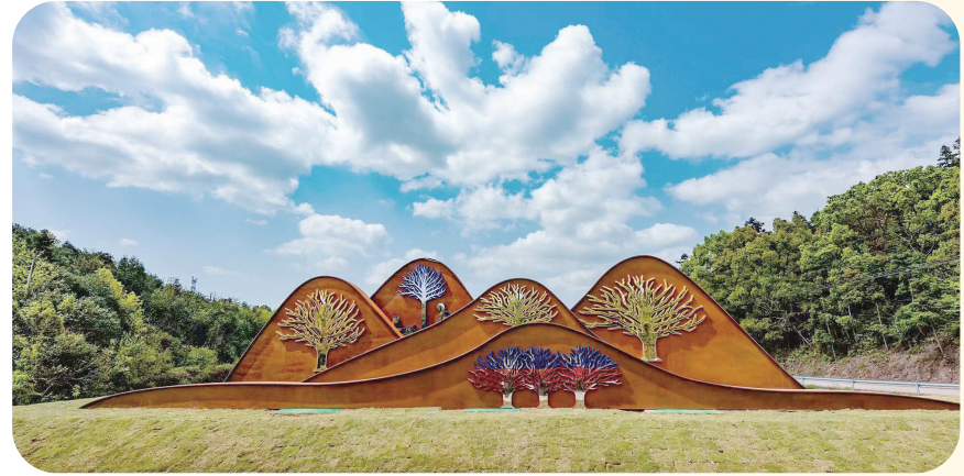
大型景观雕塑《江山多娇》。