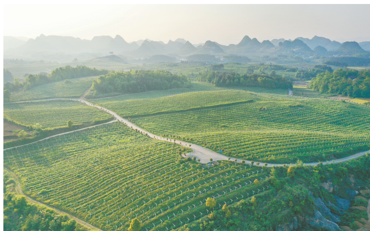
2020年5月2日,花垣县双龙镇十八洞村千亩猕猴桃种植基地生机盎然。