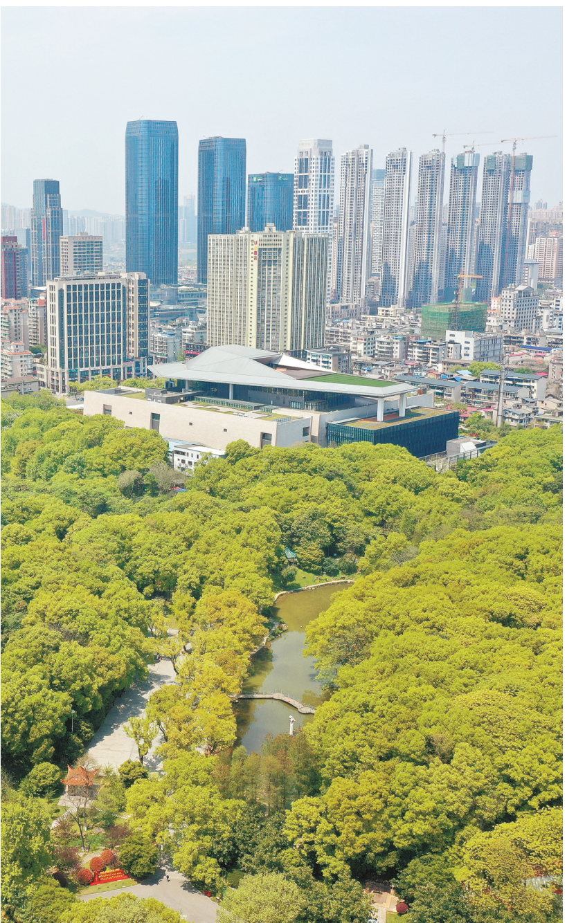
4月6日,长沙市区气温攀升,满眼绿意葱茏,尽展绿色生态新画卷。省气象台预计,未来三天三湘大地高唱“晴”歌,气温持续上升,最高可达30℃左右。