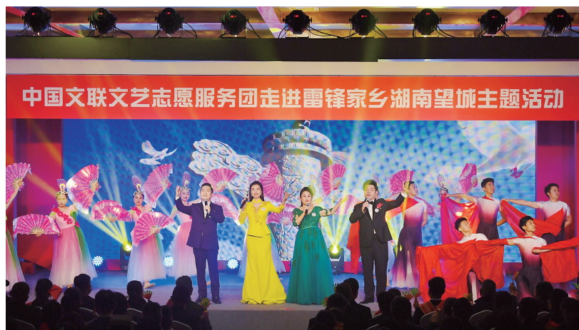
3月1日,长沙市望城区湖南雷锋纪念馆志愿者之家,演员为观众表演歌舞节目《奋进新征程》。

湖南日报3月1日讯(全媒体记者 刘瀚渝 通讯员 曹梦佳 陈薇)在第59个学雷锋纪念日到来之际,今天,“书写新时代雷锋故事”2022年中国文联文艺志愿服务团学雷锋纪念日特别活动在长沙市望城区湖南雷锋纪念馆启动。