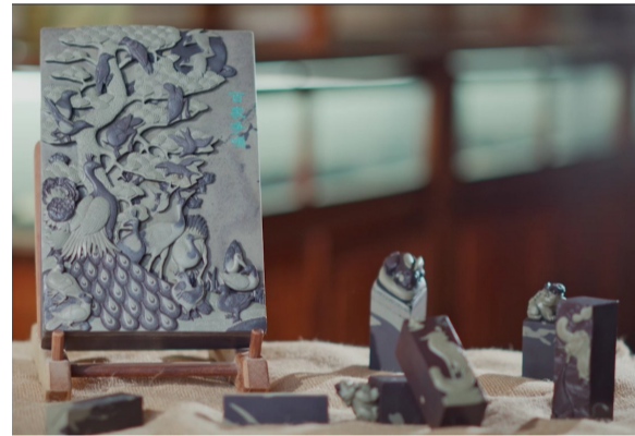
国家非物质文化遗产:贺兰砚雕刻作品。

宁夏的温泉极具特色,最受游客欢迎的还有位于银川市兴庆区的沙漠温泉度假区,这里除了温泉池还有沙浴池,充分将大漠风情和热带雨林风光融合在一起。位于银川市市区的泊心堂温泉是一家中医药温泉,店内的小庭院呈现出苏州园林般的雅致,网红漂浮餐也是游客必点的餐饮体验。外部建筑充满着异域风情的银川天山海世界,不仅深受成年人的喜爱,更是孩子们的水上乐园,即使在深冬,依旧可以体验玩水的乐趣。