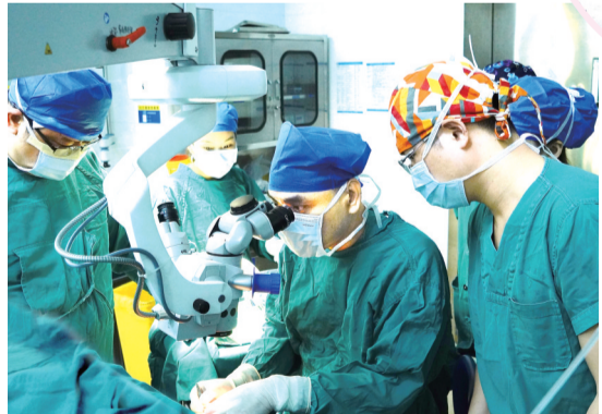
眼科医学中心完成株洲市首例深板层角膜移植手术。