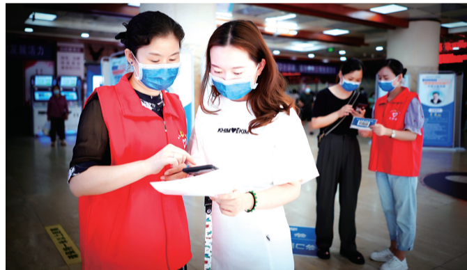
医院启动“党员服务门诊”活动，党员干部带头为群众提供更加优质高效的医疗服务。