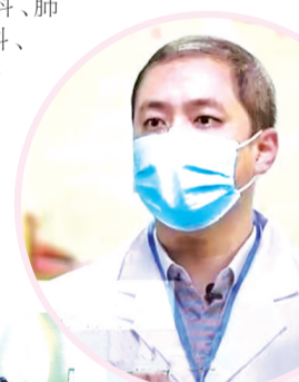
↑ 全国中药学专家张群教授在中央电视台为中医药抗疫发声。