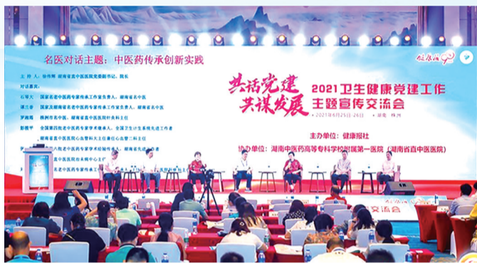
承办2021年全国卫生健康党建工作主题宣传交流会。

站在新的起点上，湖南省直中医医院将坚持公立医院姓“公”、党组织姓“党”、中医院姓“中”的根本定位，在时代节拍中顺势而为、勠力同心，致力于为三湘百姓提供更加优质、便捷、高效、满意的医疗服务，争做湖南省中医药事业发展的“中流砥柱”。