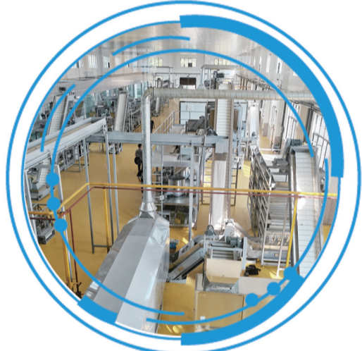
▼湘丰智能化红绿茶兼容生产线。