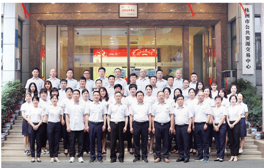
朝气蓬勃，积极向上的中心团队。

回首过去，展望未来，株洲市公共资源交易中心将始终秉持开拓创新，切实担负起服务经济、方便群众、助推发展的历史使命，为培育制造名城、建设幸福株洲作出更大的贡献。