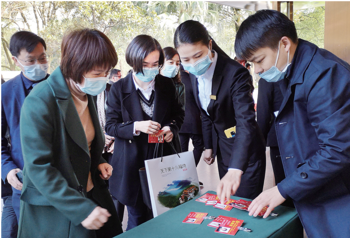
11月23日上午，郴州市出席省第十二次党代会的代表们抵达长沙蓉园宾馆，向大会报到。

湖南日报11月23日讯(全媒体记者 周帙恒)重任在肩，豪情满怀。今天，出席省第十二次党代会的代表们陆续抵达长沙，向大会报到。 上午9时，湖南日报全媒体记者来到潇湘华天酒店驻地，看到驻地布置庄重大方，各项接待工作准备就绪。“您好，请出示健康码、行程码。”在工作人员的热情指引下，党代表们一一完成报到程序，场面忙碌而有序。 即将召开的省第十二次党代会，是在实现全面建成小康社会第一个百年奋斗目标，向着全面建成社会主义现代化强国第二个百年奋斗目标迈进的关