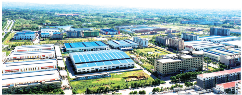
衡阳县西渡高新技术产业园区。