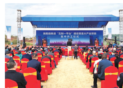
衡阳县推进“五制一平台”建设暨重大产业项目集中开工仪式现场。