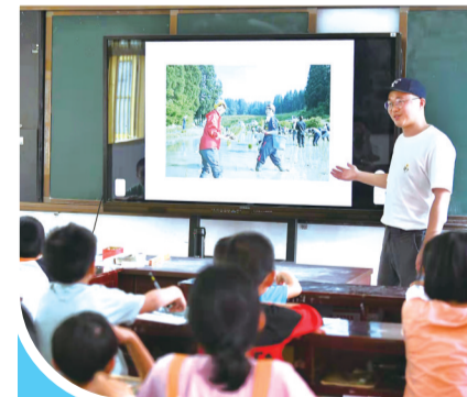
衡阳县曲兰镇返乡大学生“雁回衡阳”,丰富留守儿童暑期生活。

“时下,全县有中小學生12万人。其中,留守儿童占六成。”衡阳县委宣传部负责人说,对少年儿童的关心和教育成为全社会一项重大的课题。去年寒假期间,该县新时代文明实践中心选择岢嵫、西渡等乡镇,作为“雁回衡阳”返乡大学生新时代文明实践志愿服务项目试点乡镇。