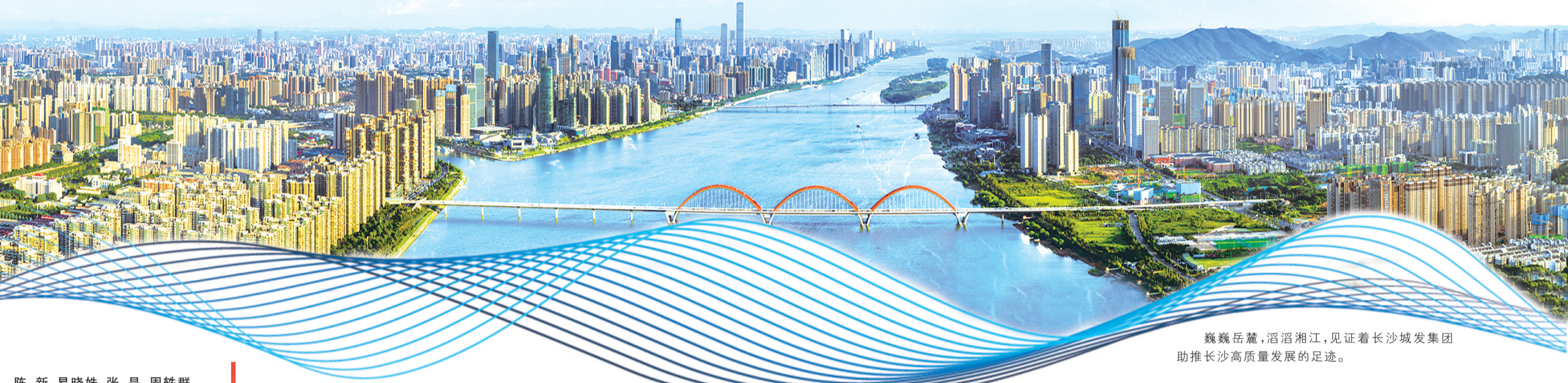
巍巍岳麓，滔滔湘江，见证着长沙城发集团助推长沙高质量发展的足迹。