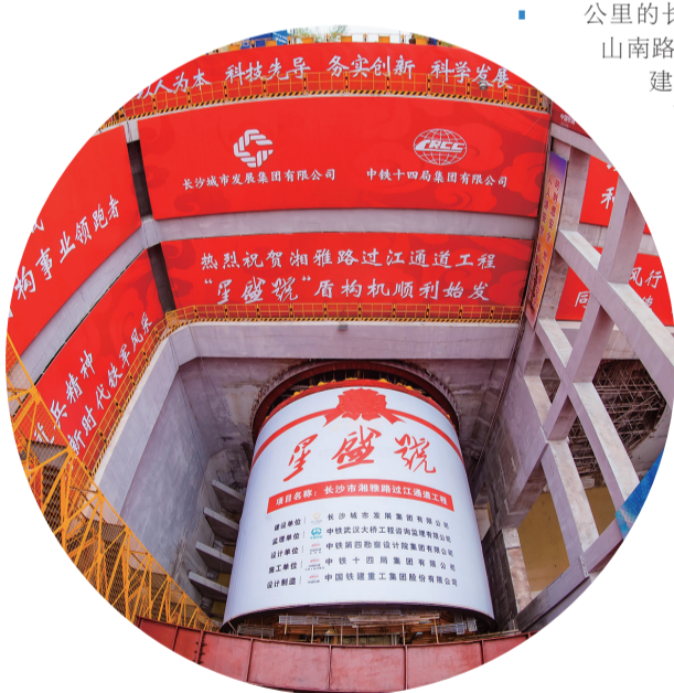
长沙湘雅路江通道“星盛号”盾构机。目前隧道已自西向东掘进700米。

党史学习教育落地见效。今年上半年，由长沙城发集团兴建的一批民生项目取得实效，磨盘洲公园、马栏山公园、洋湖湿地公园（一期）、白石湖公园开园，有效打通服务群众的“最后一米”，不断增强人民群众的获得感、幸福感。西江小学（一期）、许家园小学、麓山国际实验学校等3所学校完成建设。新建或改建公厕，提供厕位200个以上，增加社会停车位的供给3000个，高效优质完成湘雅医院周边停车提质改造，群众感受到党史学习教育带来的实实在在的变化和实效。