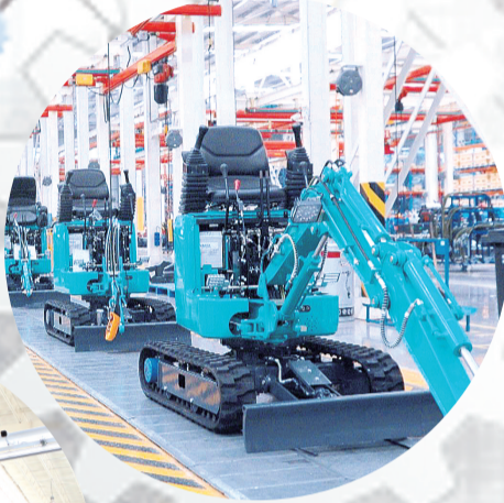
山河智能生产车间。