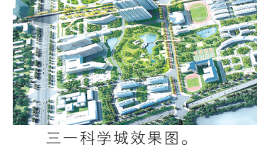
三一科学城效果图。