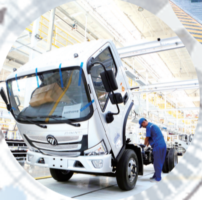
北汽福田生产车间。

三一重工挖掘机销售收入260.07亿元，同比增长39.46%，销量居全球第一；混凝土机械实现销售收入177亿元，同比增长31.05%，稳居全球第一品牌。同时，海外市场增速迅猛，今年上半年，三一重工实现国际销售收入124.44亿元，同比增长94.69%。