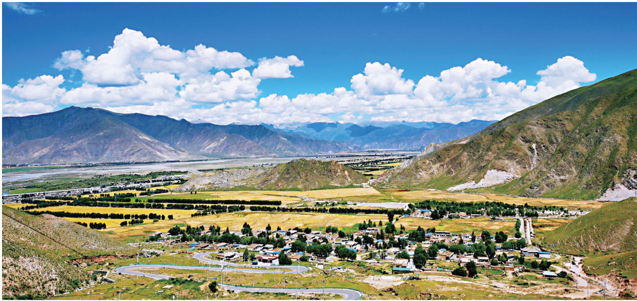
西藏拉萨市达孜区秋色(2020年8月20日摄)。

今天，让我们一起深入广袤高原，走进西藏，听听发生在这里的故事，看看这片土地70年的沧桑巨变。