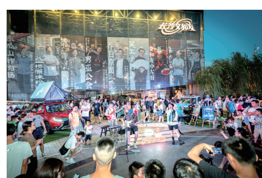
草坪露营音乐会点燃全场。