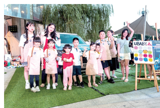
在汽车涂鸦区一起童趣互动。