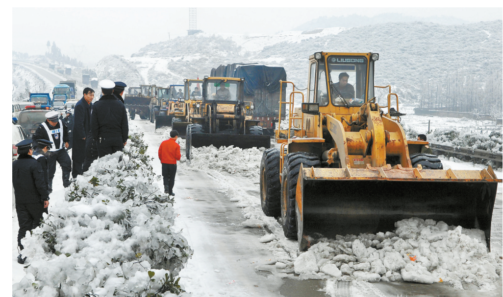
2008年2月4日，京珠高速公路郴州段，大型机械在铲除路上的厚冰，以保障公路运输畅通。