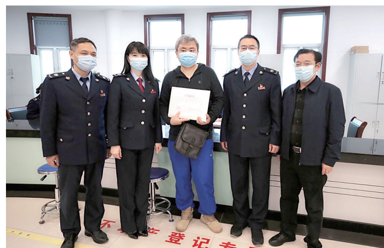
纳税人在市不动产登记窗口开福区办理二手房交易税费。