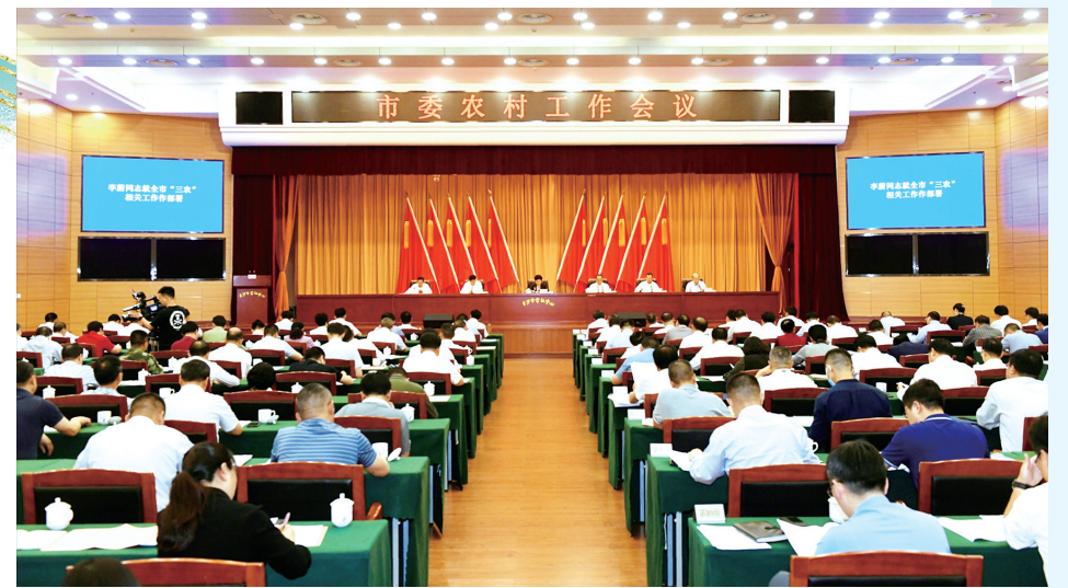
市委农村工作会议现场。

乡村活力不断激发。实施新一轮发展壮大新型村级集体经济三年行动,帮助416个集体经济收入在20万元以下的村实现了增收。创造引导农民集中居住“带地入建”模式,率先全省出台《长沙市乡村振兴产业人才队伍建设若干措施》,搭建长沙市农村综合金融服务平台,有效激发农村资源要素。