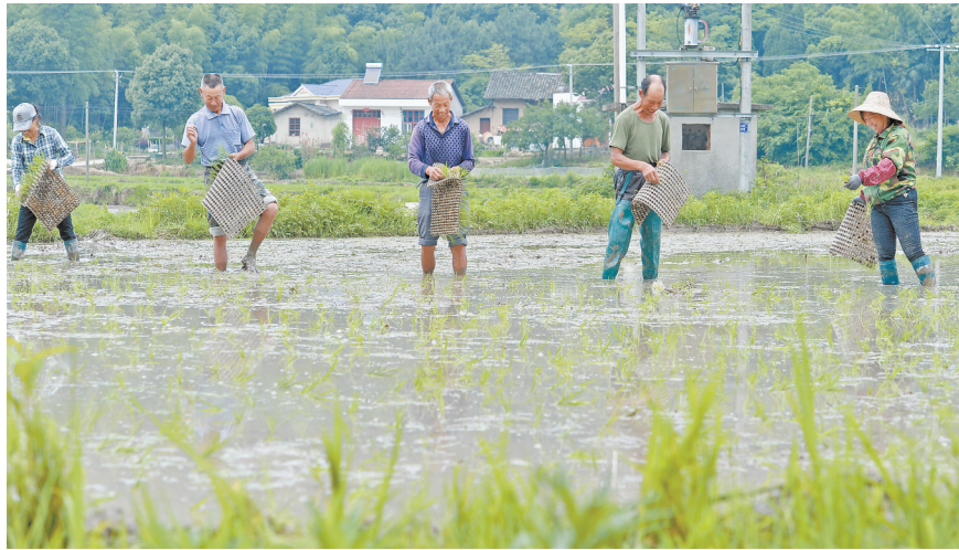
2020年5月27日,华容县三封寺镇莲花堰村,村民在龙虾养殖后的水田播种一季稻。

2018年,从G350到宝慈观一条4公里长的柏油公路拉通,5米宽的双向车道一路延伸,道路两旁一米宽的绿化带上种着两排油茶树。近年来,全村硬化公路22公