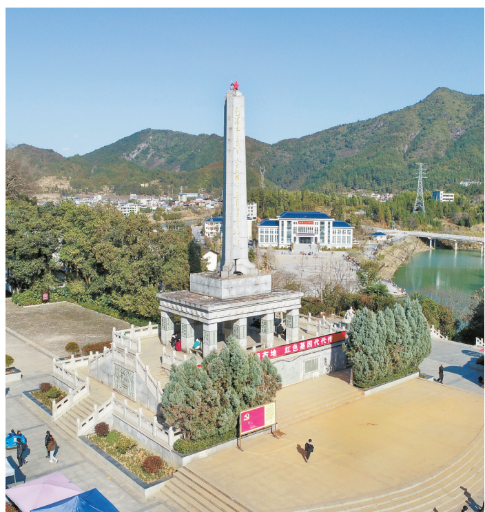
2月19日,桂东县沙田镇第一军规广场,“三大纪律八项注意”纪念碑矗立在广场中央。