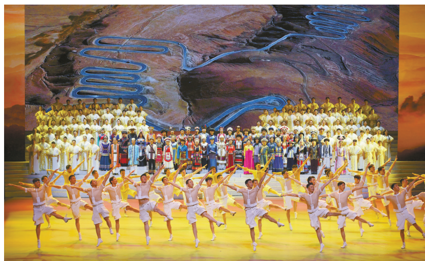
2020年11月6日晚,北京国家大剧院,大型史诗歌舞剧《大地颂歌》震撼上演。

祝中国共产党成立100周年活动总体方案(草案);通报了省委、省政府领导对省政协工作的相关批示,明确相关专门委员会跟进对接;审议了全会期间委员对省政协工作提出的意见建议,落实工作安排方案;听取了办公厅、各专门委员会、研究室对常委会工作报告中有关任务落实方案的汇报;审议了省政协2021年度协商与监督课题实施方案。