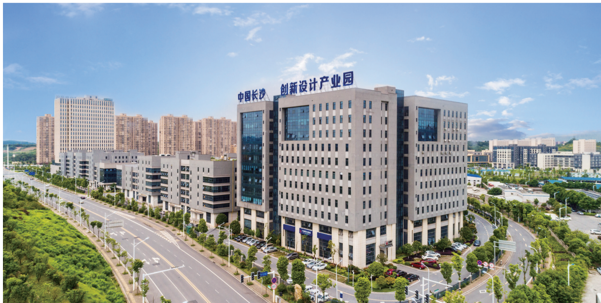
坐落于雨花经开区的中国(长沙)创新设计产业园，是我省首个、也是唯一一个大中型研发设计服务产业聚集区。

如约而至的春天，与雨花经开区机器的轰鸣、项目的施工声一道，展现出勃勃生机与希望。