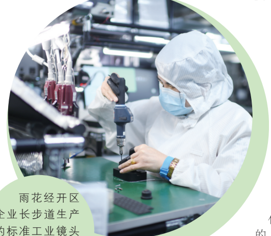
雨花经开区企业长沙道生产的标准工业镜头销售量占国内市场的17%。

这是一份承前启后的答卷——变革中的辉煌，艰难中的成就，铺就了雨花经开区“十三五”坚实的路基；带着“三高四新”战略的使命担当，雨花经开区踏上新的征程。