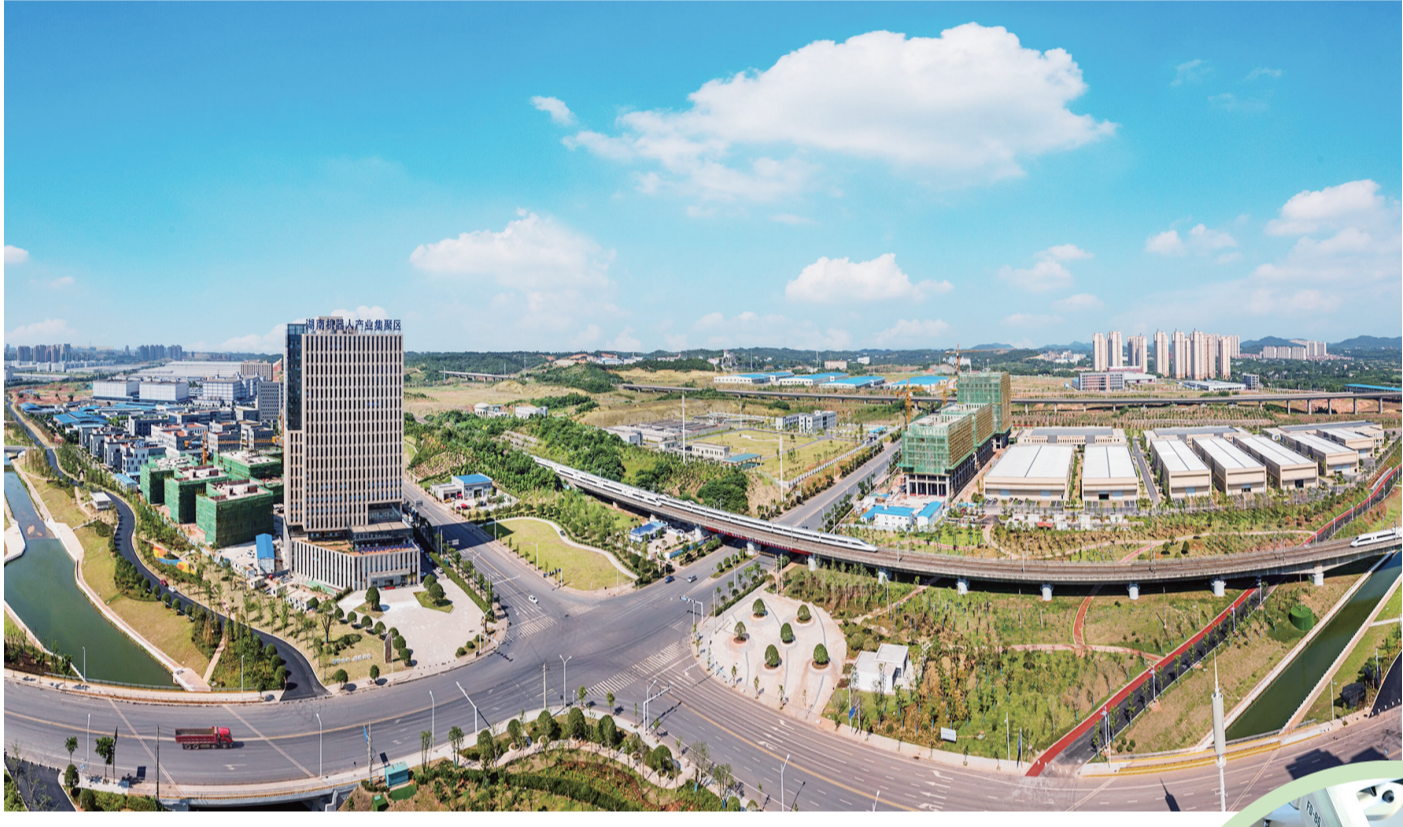
雨花经开区内，“新能源汽车+机器人”一主一特产业定位清晰。