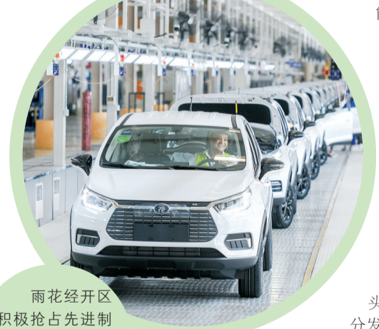
雨花经开区积极抢占先进制造业“制高点”。图为比亚迪智能化生产车间。