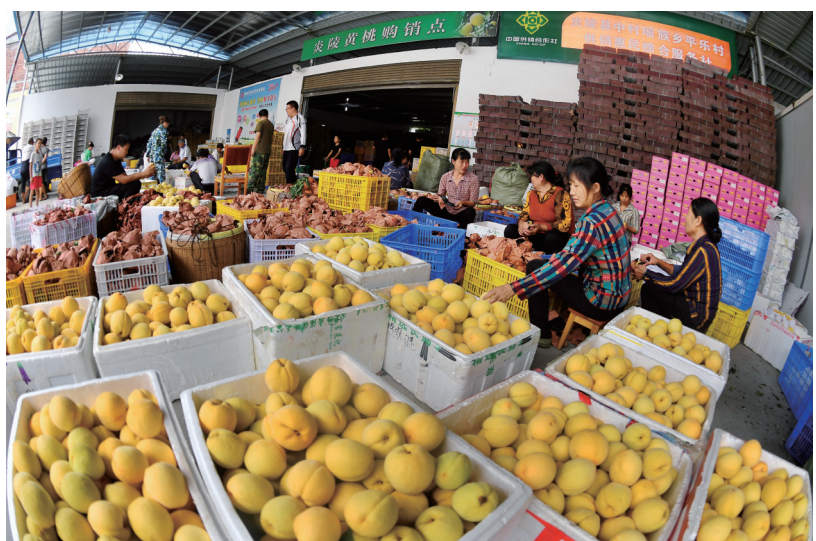
2020年7月31日，炎陵县中村瑶族乡平乐村黄桃购销点，村民在忙着分拣黄桃。

管理、统一销售，使用二维码，给黄桃贴上“身份证”，建设黄桃冷库及收购场所，为贫困户果农建设扶持台账，提供一条龙服务。