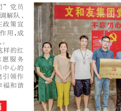
2020年6月29日，“网红”企业——湖南文和友文化产业集团有限公司宣告成立党支部，开启了企业党建领航的新篇章。

危难时刻显本色！在新冠肺炎疫情防控中，坡子街工委属各党组织和广大党员冲锋在前，举党旗、亮身份、尽责任，400余名党员干部、志愿者以网格为单元，分片包栋到户，反复开展宣传摸排；70余名“红色管家”队伍累计为550位隔离对象提供“一对