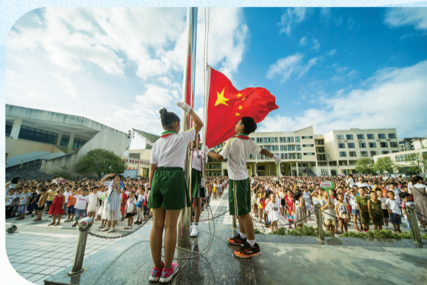
长沙援建的龙山思源学校。