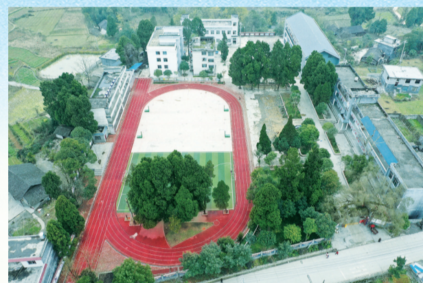
长沙援建的农车学校。