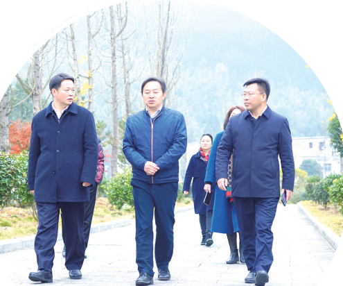
省林业局领导到九嶷山考察指导。