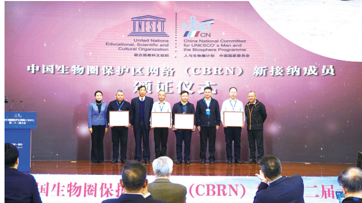
“优秀驻村工作队队长”……在各条工作战线上,九嶷山人勇挑大梁,争当先锋,以崭新面貌亮出了“九嶷山”名片,2020年7月森管局机关党支部被县委评为“五星党支部”!