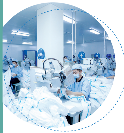
一揽子政策保障防疫物资生产,湖南永耀的工作人员鼓足干劲、加班加点生产防护用品。