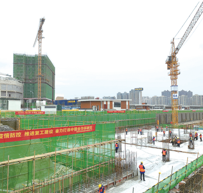
政策红利催动复工潮。湖南建工集团承建的德国卓伯根商业综合体项目全面复工复产。