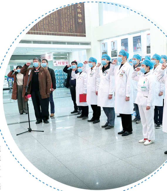
财政补助解决后顾之忧,郴州市中医医院新冠肺炎医疗救治“党员先锋队”宣誓守卫一线。

强化金融支持,省财政落实中央再贷款财政贴息政策,降低防控物资生产企业融资成本,截至2020年5月末,全省对223家重点名单企业发放优惠利率贷款99.7亿元,争取中央贷款贴息1.23亿元。对确实发生损失的小微企业贷款,优先纳入信贷风险补